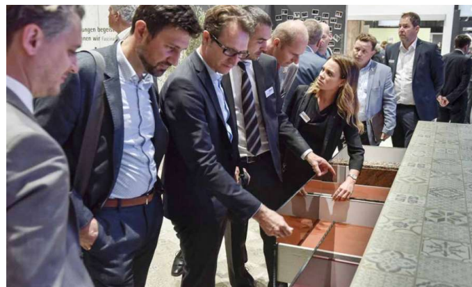
LO STAND DI HETTICH A INTERZUM 2019