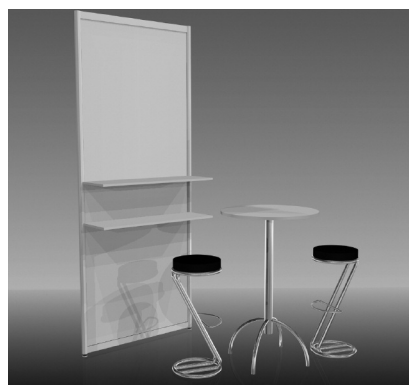
Fornitura di mobili A

Foro competente e luogo di adempimento è Colonia.