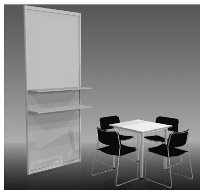
Fornitura di mobili C